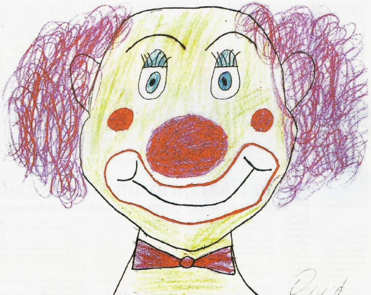
Clowns gibt es auch in der Circusschule Jokes.